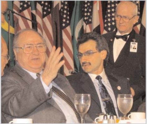
السناتور السابق جيمس أبو رزق مع سمو الأمير الوليد بن طلال

بطاقة ADC لمساندة الجالية العربية الأمريكية