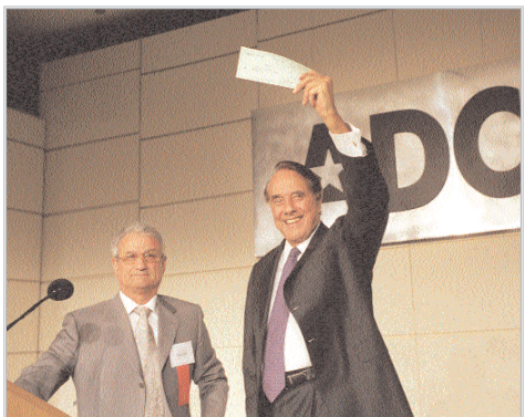
احمد سباتي يقدم للسيناتور بوب دول تبرعات ADC لصندوق المنح الدراسية

لعائلات الحادي عشر من أيلول خلال مؤتمر ADC لعام 2002