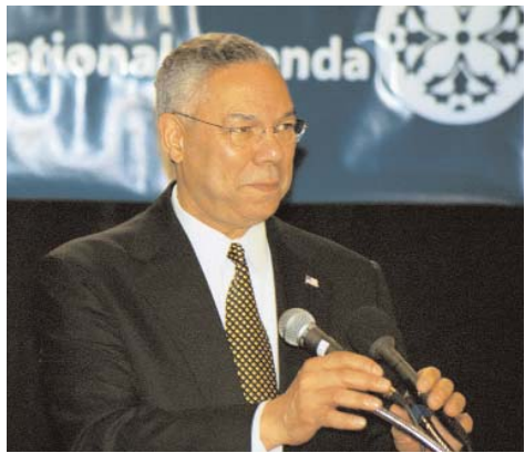
وزير الخارجية كولن باول يلقي كلمة خلال مؤتمر ADC لعام 2003